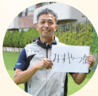
逆さしりとりウォーキング