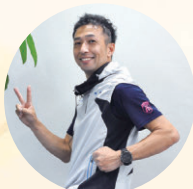
じゃんけんウォーキング